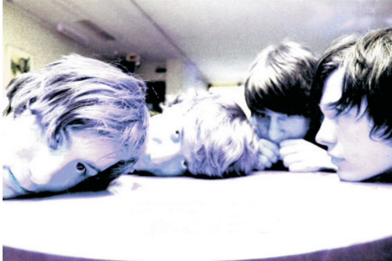
Gammalapagos aus Flöha bei Chemnitz gewannen 2002 das Finale des Bandwettbewerbes Local Heroes