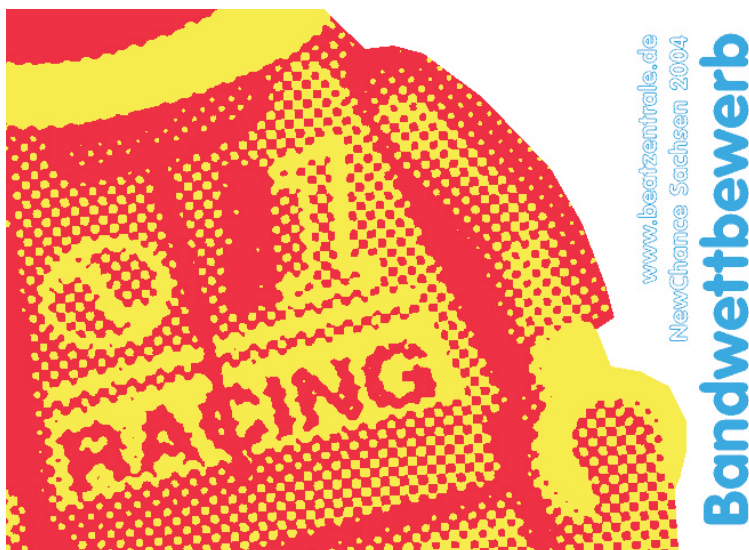
Ausschreibungsflyer NewChance Sachsen